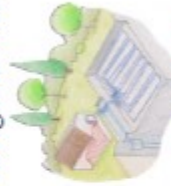
Les énergies géothermique et aérothermique